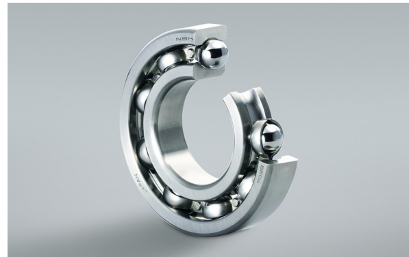
↑ Roulement à billes à gorges profondes avec solution de lubrification longue durée