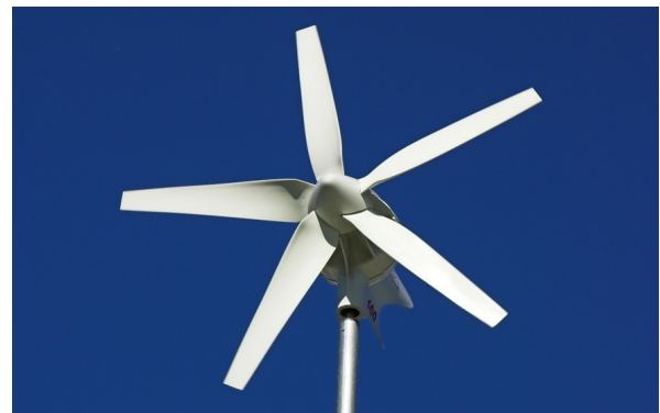
↑ Micro-Turbine Eolienne